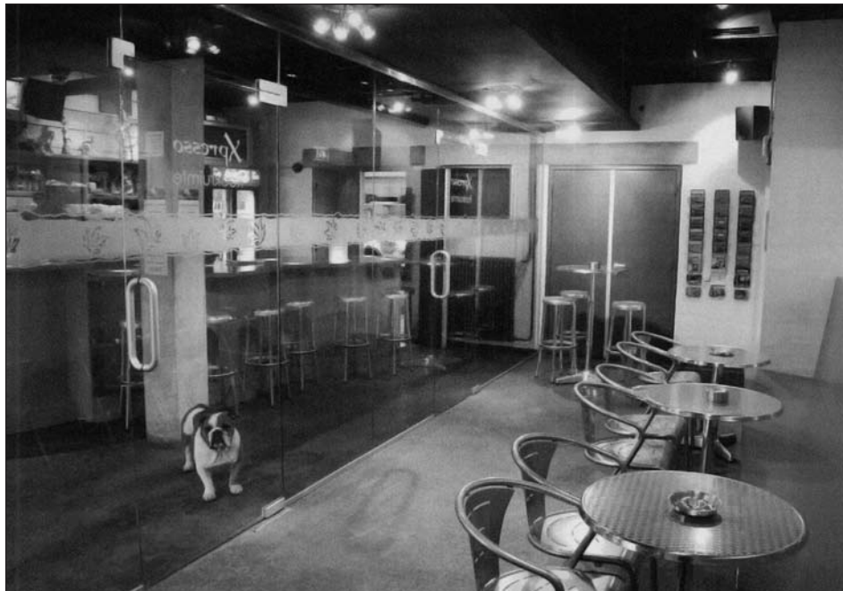
Figuur 3 Voorbeeld van een rookruimte. Dreigt de sociale functie van de coffeeshop verloren te gaan?

terwijl 27% aangaf dat de overlast gestegen is (1 coffeeshop gaf aan dat de overlast minder is geworden). De meeste last ondervindt men van “meer mensen die buiten voor de coffeeshop sigaretten (en joints) roken” en van “buiten voor de coffeeshop rondhangende groepjes mensen”. Zie voor een overzicht van de gegevens Tabel 4.