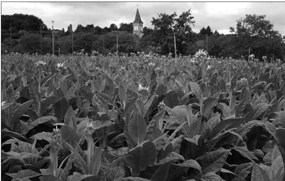
Figuur 1 Bloeiende tabaksplanten ( Nicotiana tabacum ) in de Franse Dordogne.

De Voedsel en Waren Autoriteit, VWA, (voorheen Keuringsdienst van Waren) is belast met het toezicht op de naleving van de rookvrije horeca. De dienst beschikt over controleurs die hier speciaal voor zijn opgeleid. Wordt de Tabakswet overtreden dan kan een boete worden opgelegd. In dat geval maken de controleurs een boeterapport op, dat wordt verzonden naar en beoordeeld door de Afdeling Bestuurlijke Boetes. De Afdeling Bestuurlijke Boetes is een onafhankelijk bureau, dat handelt namens de Minister van VWS. Een eerste overtreding van het rookverbod en rookvrije werkplek kan een boete van € 300 opleveren. Bij volgende overtredingen verdubbelt dit en kan de boete oplopen tot € 2.400 per overtreding. De VWA controleert in coffeeshops organoleptisch (ruiken en zien) of er in een joint ook tabak zit. Alleen in de aparte rookruimten mogen tabaksproducten gerookt worden.[9-12]