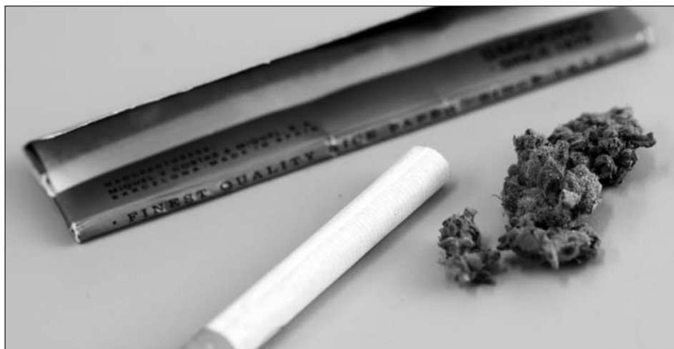
Figuur 2 Ingrediënten voor het maken van een joint. In Nederland bestaat een joint meestal uit een combinatie van cannabis en tabak.

pure joints (optie C), 6 coffeeshops hebben ervoor gekozen de gehele coffeeshop rookvrij te maken (optie E), 3 keer is er voor gekozen om de coffeeshop om te bouwen tot louter een afhaaloket (optie A) en 9 maal is aangegeven dat de coffeeshop vóór de invoering van de rookvrije horeca al een afhaaloket was of heeft men overige maatregelen genomen (optie F), bijvoorbeeld een zeer goed werkend afzuigsysteem. Optie D (geen sigaretten toestaan, maar wel joints met tabak) werd 19 maal genoemd, maar wordt niet onder "het nemen van maatregelen" geschaard. Zie voor een overzicht van de gegevens Tabel 3.